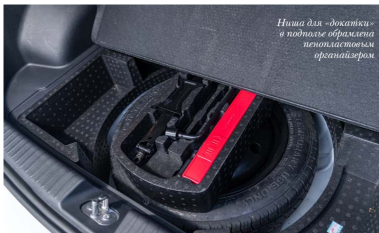
Ниша для «докатки» в подполье обрамлена пенопластовым организатором